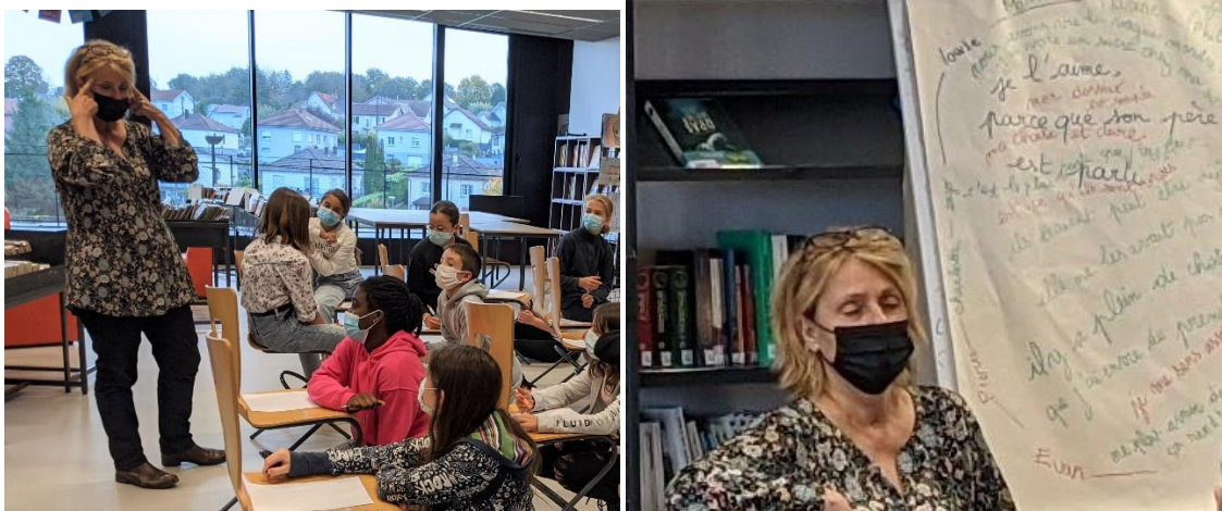
On s'installe confortablement pour plonger dans ses pensées, dans le silence, puis l'auteure lit, en boucle, les phrases recueillies, et les élèves se mettent à écrire...