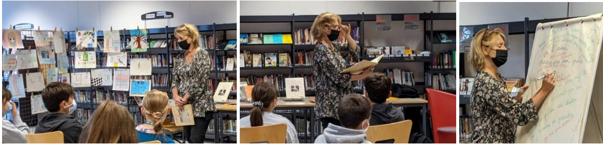
NBC devant les illustrations des élèves, avec Marie de la mer à la main ; elle lit des extraits de ses albums ; écrit des « morceaux » des questions des élèves.